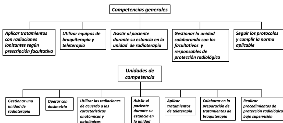
Figura 2. Competencias generales y unidades de competencia del TSRR

Las competencias generales de los TSRD y sus correspondientes unidades de competencia se resumen en la figura 2.